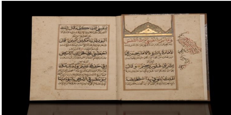
Gambar 1. Naskah A.50

Sultan Banten yang bernama 'Ali ad-Din ibn Sultan Muhammad 'Arif.