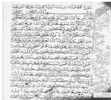
Gambar 4: Naskah A.53

Naskah A.53: menurut penulis sebenarnya tafsir yang dikenal dengan sebutan naskah A.53 ini hampir sama dengan naskah A.52 diatas, dimana naskah ini terdiri dari sepuluh jilid bagian yang dimana setiap jilidnya memuat tiga juz dan pada setiap jilidnya juga diberi kode [a]-[k] dengan mengecualikan pada huruf [i]. Adapun ukuran yang terdapat pada naskah ini yaitu berukuran setebal 44 x 22,5 cm yang mana disetiap masing jumlahnya terdiri dari 17 baris. Dan ternyata pada setiap jilid mempunyai ketebalan masing-masing setebal 1 cm dengan disetiap jumlah jilidnya [a] 62; [b-i] 60; dan [k] 66 halaman. Adapun dalam penulisan lafal Allah pada naskah ini ditulis dengan menggunakan tinta berwarna merah begitu juga pada tanda bacanya baik pada setiap bagian maqra' dan rubu halamannya. Tata letak penulisannya berbentuk segi empat kecil yang dikelilingi dengan berbagai bentuk ragam qira'at sab'ah .