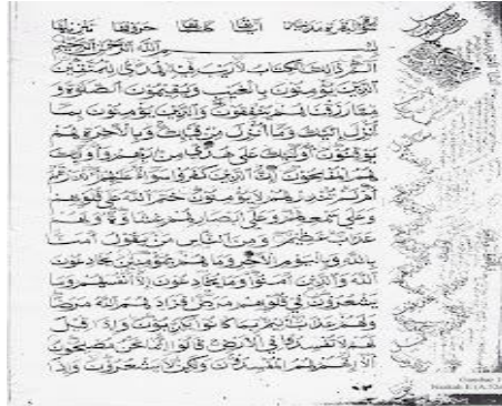
Gambar 3: Naskah A.52

mengenai informasi pada tahun berapa naskah ini ditulis, namun menurut cap kertasnya naskah ini diperkirakan disalin pada abad pertengahan sampai akhir abad ke-18. Dan tidak ada keterangan dalam naskah ini berasal dari mana, akan tetapi jika dilihat dari karakter hurufnya naskah ini diduga berasal dari daerah Banten.