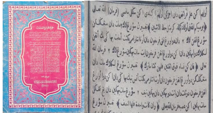
Gambar 6: Kitab Jam'ū Jawami' al-Mushannafat

Tafsir Marah Labid karangan ulama' tersohor; Syaikh Nawawi ketika beliau tinggal di Mekkah, awal mulanya beliau juga tidak berniat untuk menulis sebuah karya tafsir. Namun karena desakan dari teman-temannya yang mendukung Syaikh Nawawi untuk membuat tafsir, akhirnya beliau menuliskannya dalam bentuk 30 juz dari al-Fatihah sampai an-Nas secara sistematis dan runtut. Penggunaan aksara bahasa Arab menjadi pembeda dengan karya tafsir di abad sebelumnya yang menggunakan bahasa Jawa, Sunda, dan Melayu. Tafsir Marah Labid pertama kali dicetak di Kairo Mesir pada 1305 H. Berbeda dengan Tarjuman al-Mustafid yang merupakan "terjemahan" dari tafsir Jalalain dengan tambahan rujukan dari tafsir Khazin, Bagawhi, dan Baidhawi . Justru tafsir Marah Labid yang muncul di era abad ke-19 ini merujuk pada beberapa tafsir diantaranya yaitu tafsir Futuhāt al-Ilahiyyah, Mafatih al-Ghayb, al-Siraj al-Munir, Tanwirul Miqbas fi Tafsir Ibbnu Abbas yang ditulis oleh Fairuzabadi, tafsir Abu Su'ud , dan Irshad al-'Aql al-Salim ila Mazaya al-Kitab al-karim karya Abu Su'ud al-Hanafi (Bahary, 2015: 186).